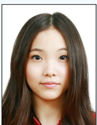
頭髮遮蔽 到眼睛或 耳朵