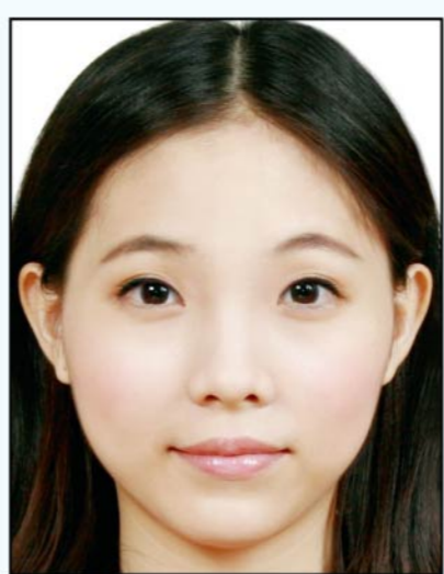
頭部比例 過大或頭 髮碰觸到 照片邊框