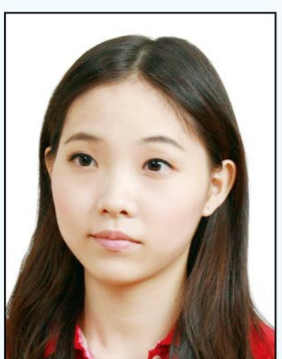
頭部側向 一邊、未 正視鏡頭