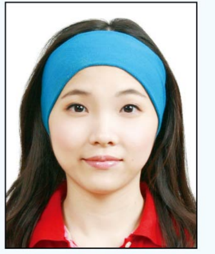
臉部及雙 耳被物品 遮蔽